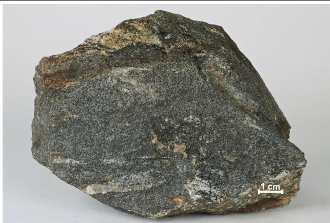
Makroskopický vzhled horniny

Amfibolity, vystupující na lokalitě, jsou součástí tělesa bazických a ultrabazických hornin trojúhelníkového tvaru o délce okolo 14 km a šířce až 4 km, které je situováno na nejzápadnějším okraji domažlického krystalinika střeďočeské oblasti, bezprostředně při jeho tektonickém kontaktu s jednotkou moldanubika. Hornina je středně zrnitá, tmavě šedá, rezavě hnědě navětrávající, zpravidla masivní textury, jen místy se světlými čočkovitými polohami nebo náznakem páskování. Horninotvorné minerály jsou reprezentovány plagioklasem a monoklinickým amfibolem, v malé míře je též zastoupen chlorit.